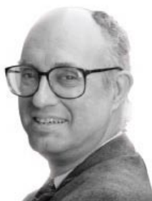
BILD programose – geriausi pasaulyje ekspertai

„Įmonės konkurencinį pranašumą, kuris slypi paslėptoje jos darbuotojų vertėje, konkurentams labai sunku kopijuoti“.